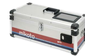
活用事例：次世代型上部消化管内視鏡用シミュレータの開発（株式会社R0）