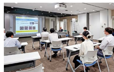
バイオ人材育成セミナー