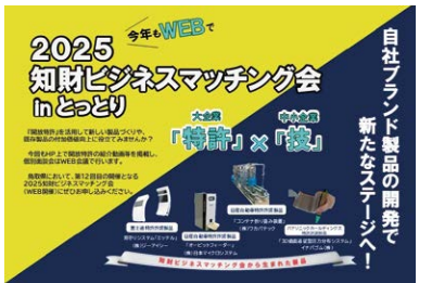
2025知財ビジネスマッチング会