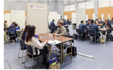
九州・中国7県合同広域商談会（福岡）