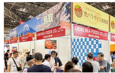
日本の食品輸出EXPO（東京）