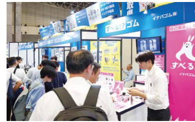
第30回機械要素技術展（東京）