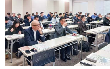
省エネ診断報告会及び特別講演