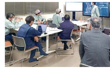
専門家派遣による現場指導の様子