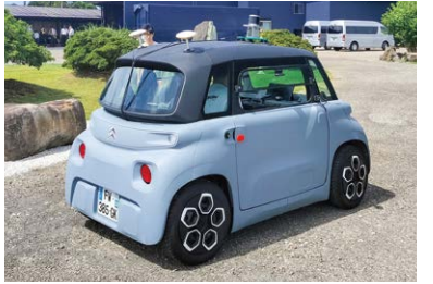
自動運転の実証実験