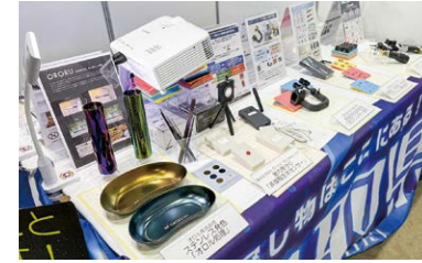
メディカルクリエーションふくしま2025（福島）