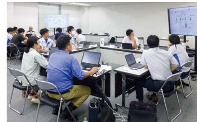
スマートものづくりエキスパート育成スクール