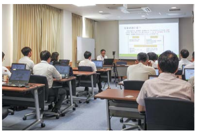
事業承継セミナー